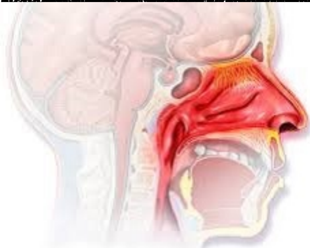
Hình 2: Niêm m c mũi xung huy t trong ch y máu cam