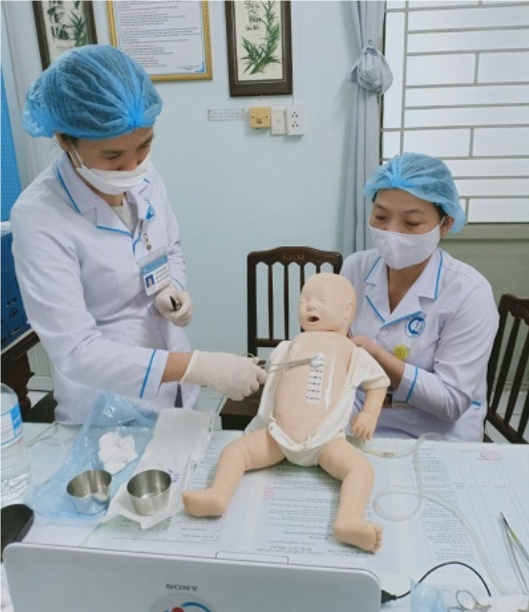
Khoảng 18h00 ngày 08/12/2021, y tá và nhân viên đa khoa tỉnh đã học tập trực tuyến về kỹ thuật đặt ống BSI ở bệnh nhân nhi.

Thứ 08, 08 Tháng 12 2021 15:44 - Lần cập nhật cuối Thứ 08, 08 Tháng 12 2021 16:02