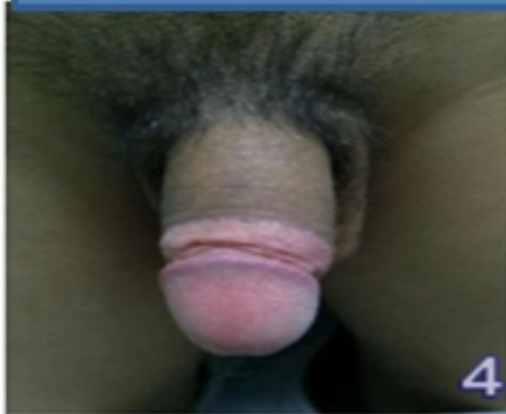
Một tháng sau phẫu thuật