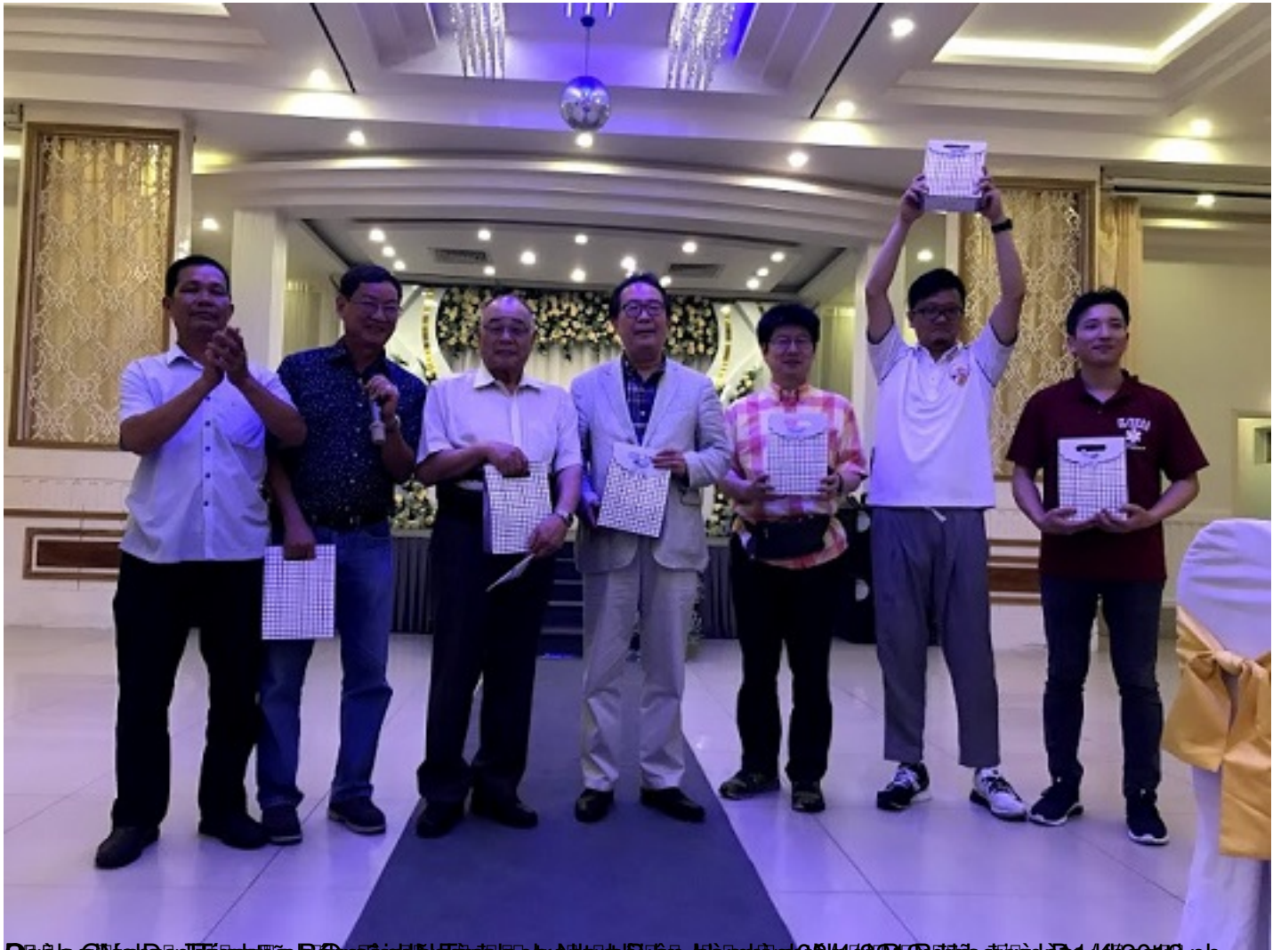
Đoàn Công tác Tỉnh ủy Bắc Sơn nhận Bằng khen của UBND tỉnh Bắc Sơn và Bằng khen của UBND tỉnh Bắc Sơn. Hình ảnh: Đoàn Công tác Tỉnh ủy Bắc Sơn nhận Bằng khen của UBND tỉnh Bắc Sơn và Bằng khen của UBND tỉnh Bắc Sơn. Hình ảnh: Đoàn Công tác Tỉnh ủy Bắc Sơn nhận Bằng khen của UBND tỉnh Bắc Sơn và Bằng khen của UBND tỉnh Bắc Sơn.

Thứ hai, 15 Tháng 4 2019 10:06 - Lần cập nhật cuối: Thứ bảy, 23 Tháng 11 2019 15:42