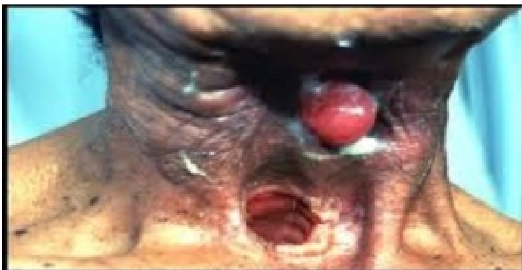
HÚT THUỐC GÂY UNG THƯ HỌNG, THANH QUẢN

Tác hại của việc hút thuốc lá gây ra rất nhiều bệnh, hầu như tất cả nó làm gánh nặng cho gia đình, ảnh hưởng đến chất lượng cuộc sống và chi phí của xã hội. Việc chi trả tiền cho mua thuốc lá có thể giúp giảm bớt gánh nặng cho rất nhiều người trong gia đình.