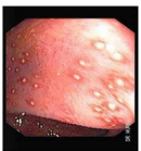
Hình 1.1: Viêm loét đại tràng do amíp: Các vết loét hình cĩa chai.

Đĩi thĩ : Các vị trí thĩng gặp cĩa tổn thĩng là manh tràng, các góc đĩ i tràng và trực tràng. Tổn thĩng ban đĩu như cĩa đĩu kim. Sau đĩ, amíp xuyên qua lớp đĩĩi niêm mĩc rồi lan tràn tạo thành nhĩng vết loét hình cĩa chai có bờ vàng nâu nhĩm, có đáy là lớp đĩĩi niêm mĩc hoặc lớp cĩa.