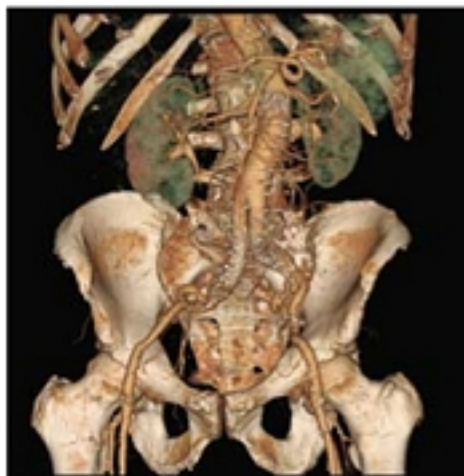
Tái tạo thể tích động mạch với toàn bộ xương