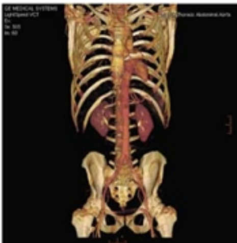
Giải phẫu động mạch ngực bụng

Chúng tôi xin gi i thi u m t s hình nh các c quan c a c th khi s d ng máy CT 64 d y sau đây: